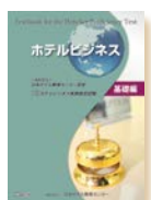
ホテルビジネス基礎編 ベーシックレベル1-2級準備 定価 5,000円 + 税