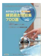
ホテルビジネス練習過去問題集700選 定価 1,000円 + 税