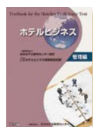
ホテルビジネス管理編 マネジメントレベル準備 定価 5,000円 + 税